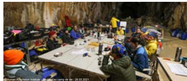
Réunion au camp de vie - 26.03.2021

Durant plusieurs semaines, à l'initiative du muséum national d'histoire naturelle de Paris, une équipe internationale de 22 chercheurs va tenter d'atteindre et d'explorer pour la première fois le cœur de cette Terra Incognita, véritable temple de la biodiversité où tout reste à découvrir.